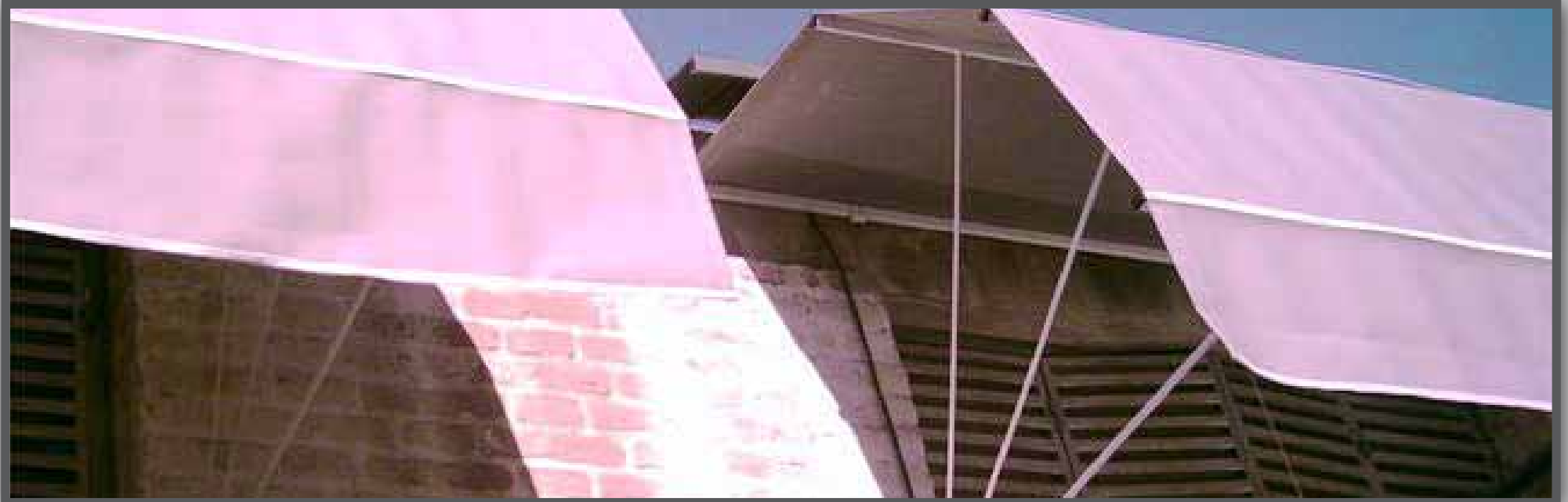
Las imágenes de producto son de carácter ilustrativo.